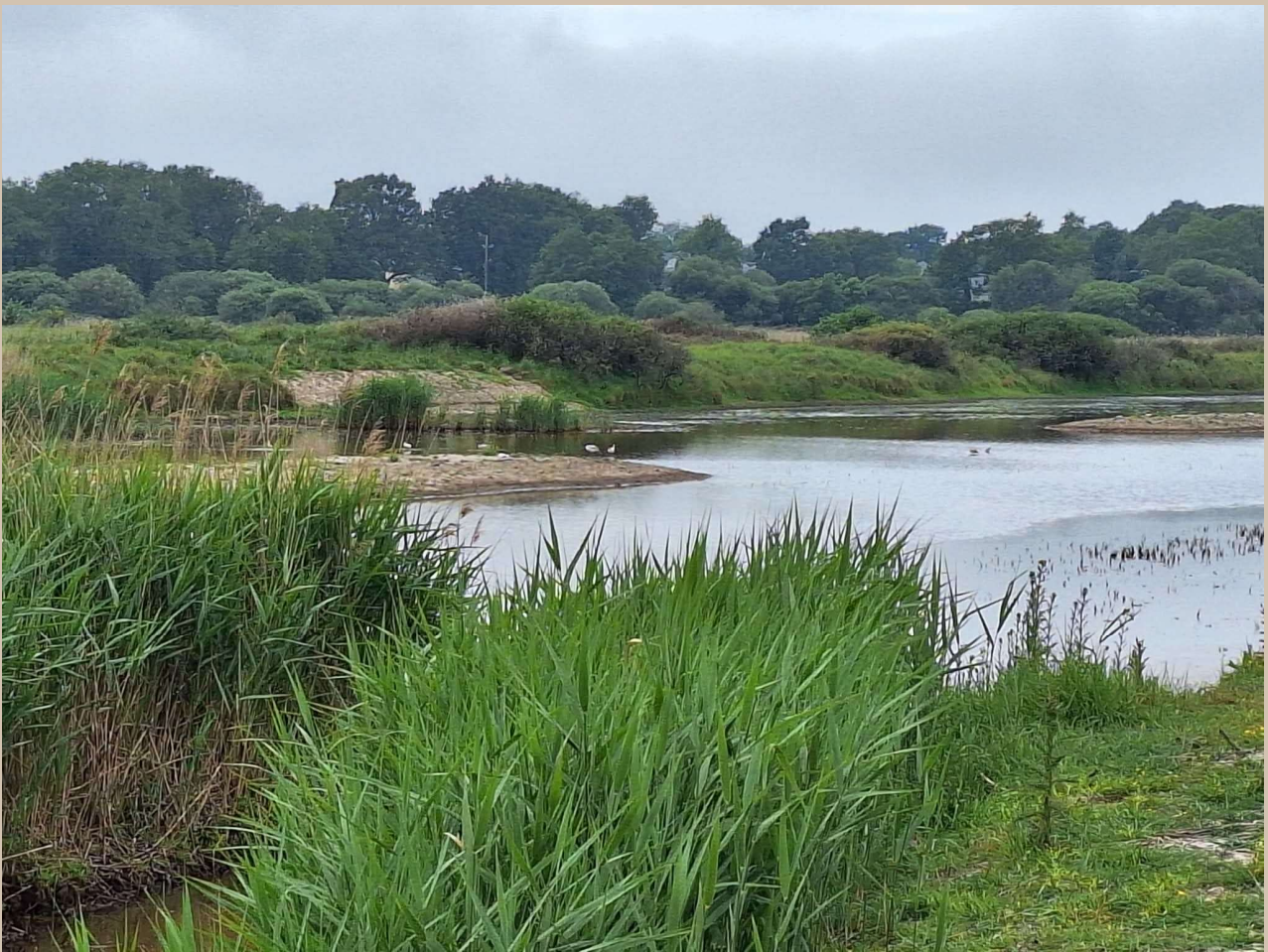
Marais du Mar

rapide de ces aménagements par l'avifaune. Côté habitats, si les effets restent pour l'instant encore peu perceptibles à cette échelle de temps, les premières évolutions observées laissent entrevoir une dynamique favorable, qui devra se confirmer dans les mois et années à venir.