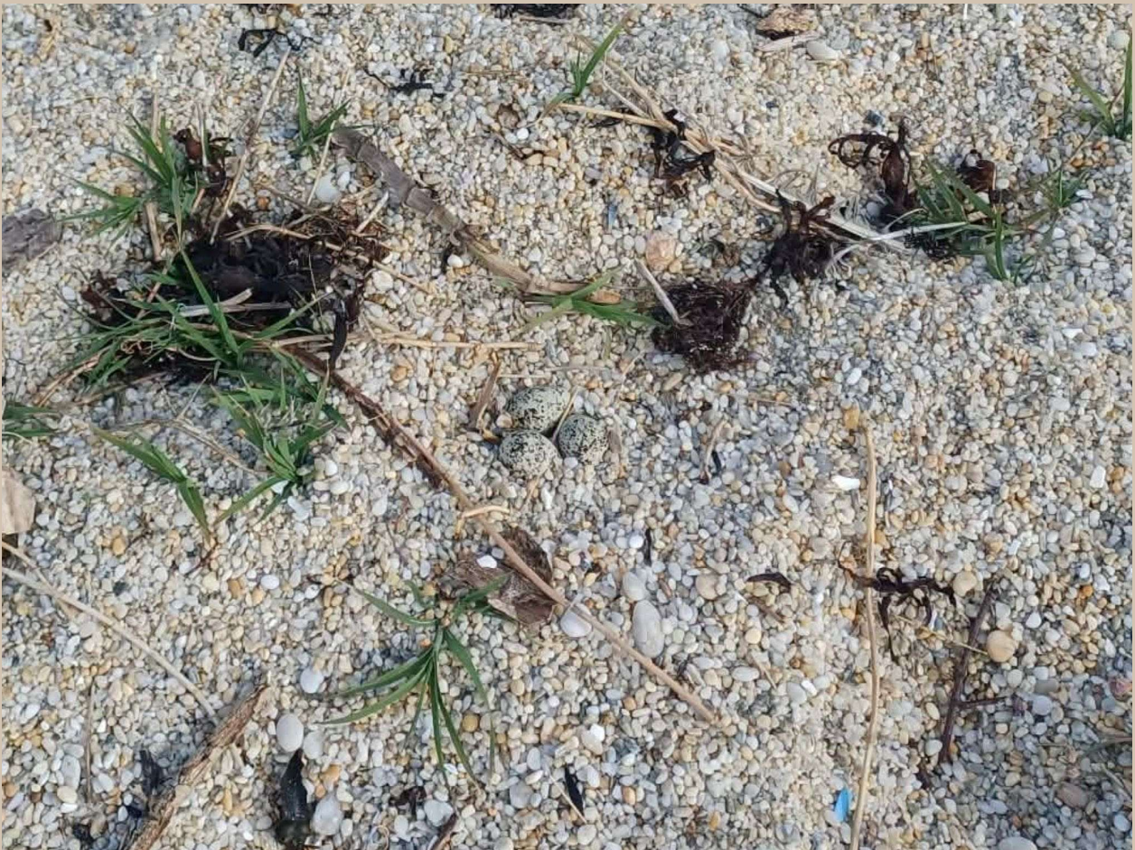
Nid de Gravelot avec trois œufs

Le Gravelot à collier interrompu est un petit limicole discret, parfaitement adapté aux milieux littoraux. Étroitement lié aux plages de sable et de galets, il se nourrit de petits invertébrés qu'il capture en courant sur le rivage. Pour élever ses jeunes, il ne construit pas de nid : il creuse à même le sable une petite cuvette et y dépose simplement ses œufs.